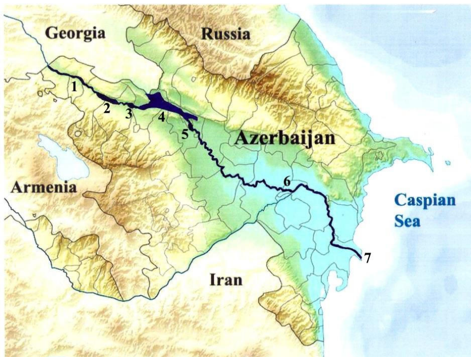
Рис. 1. Участки проведения исследований: 1 – Газахский участок ( 41^{\circ}14'48''\text{N} 45^{\circ}26'34''\text{E} ); 2 – Шамкирское водохранилище ( 40^{\circ}59'18''\text{N} 46^{\circ}03'04''\text{E} ), 3 – Еникендское водохранилище ( 40^{\circ}57'11''\text{N} 46^{\circ}12'54''\text{E} ); 4 – Мингечаурское водохранилище ( 40^{\circ}59'34''\text{N} 46^{\circ}59'12''\text{E} ); 5 – Варваринское водохранилище ( 40^{\circ}44'48''\text{N} 47^{\circ}02'50''\text{E} ); 6 – от Варваринской плотины до слияния с Араксом ( 40^{\circ}01'21''\text{N} 48^{\circ}25'50''\text{E} ); 7 – устье Куры ( 39^{\circ}22'45''\text{N} 49^{\circ}20'04''\text{E} ).

Материалом послужили сборы паразитов судака, проведенные в 1999-2015 гг. в реке Кура от границы с Грузией и до Каспийского моря; в придаточных водоемах Куры, в Мингечевирском, Варваринском, Шамкирском и Еникендском водохранилищах, в реке Кура от Варваринской плотины до слияния с рекой Аракс, и от слияния с рекой Аракс до устья реки Куры (рис. 1).