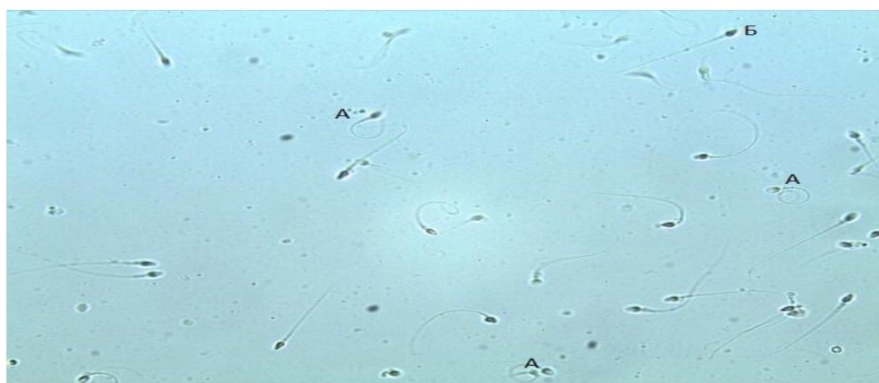
Рис. 2. Дегенеративні сперматозоїди: А – патологія хвоста; Б – патологія головок сперматозоїдів. Збільшення мікроскопа \times 80

На рис. 1 видно наявність аглютинації – склеювання рухливих сперматозоїдів один з одним в окремі конгломерати. Аглютинація сперматозоїдів виникає в результаті порушення гематотестикулярного бар'єру. Як наслідок, сперматозоїди починають контактувати з імунною системою, тоді чоловічий організм виробляє особливі білки – антиспермальні антитіла, які розташовуються на поверхні гамет. Це й провокує порушення їхньої рухливості внаслідок склеювання. Таке порушення значно знижує здатність до запліднення чоловіків [9].