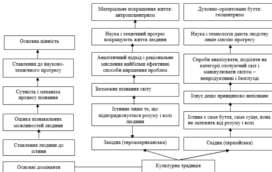
Рис. 2. Домінантні відмінності східної і західної культурної традиції

Соціокультурний світ етнонаціонального буття західної чи східної парадигми – це суспільство з властивим йому особливим, унікальним і неповторним типом культури.