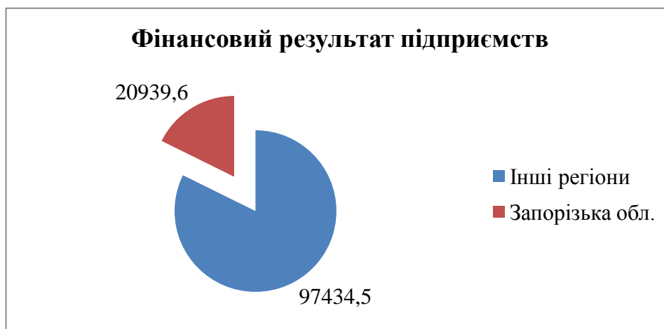
Рис 1. Діаграма фінансового результату підприємств регіонів України, млн грн

Територія країни нараховує 253092 підприємства на 24 області. Запорізький регіон нараховує 14576 підприємств, що складає 5,76%. Серед усіх областей Запорізька займає 5-те місце. На першому місці Дніпропетровська – 27892 одиниці, далі йде Одеська – 24023 од., Харківська – 22507 од. та Київська – 19339 од. На цьому фоні Запорізький регіон є досить вагомим для країни взагалі. За 2017 рік фінансовий результат підприємств нараховує 118374,1 млн грн. Із цього Запорізький регіон нараховує 20939,6 млн грн, що є 17,69% від загальної суми. На рис. 1 ми зобразили діаграму, що показує, яку частину займає Запорізький регіон.