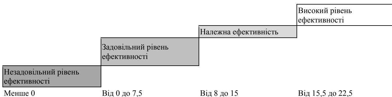
Рис. 1. Шкала для оцінювання ступеня ефективності системи ризик-менеджменту на підприємстві

Цікаво також розглянути наочно вплив окремих показників на інтегральну оцінку за допомогою пелюсткової діаграми, наведеної на рис. 2