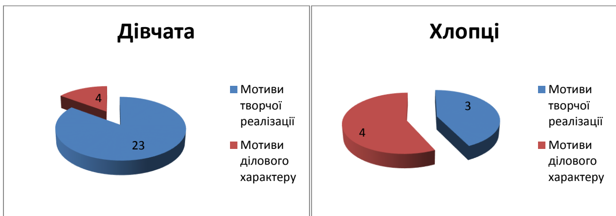
Рис. 2. Результати методики «Мотиви вибору професії» (С. Гриншпун)

Аналіз даних, отриманих за методикою С. Гриншпун, показав, що міські мешканці більше орієнтовані на мотиви творчої реалізації, тоді як у сільських жителів переважають мотиви ділового характеру. Порівняння результатів за гендерною ознакою свідчить, що у хлопців із сільської місцевості домінують мотиви ділового характеру, а у дівчат – мотиви творчої реалізації; в учнів з міста превалюють мотиви творчої реалізації – як у дівчат, так і у хлопців (див. рис. 2).