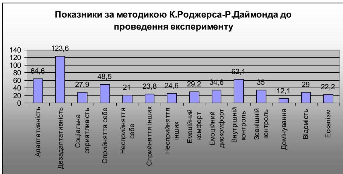
Рис. 1. Результати дослідження за методикою К. Роджерса-Р. Даймонда

Так, першокурсникам притаманні такі показники за бальною системою: ескапізм (уникання проблем) – 22,2 свідчить про включеність у навчальний процес; керованість – 29,4 свідчить про те, що вони підкоряються загальним вимогам навчального процесу; показник домінування – 12,1 знаходиться в межах норми; зовнішній контроль входить до середнього рівня – 35,0 і знаходиться в межах норми; внутрішній контроль входить до високого рівня – 62,1 бали – і свідчить про перебудову та включеність до навчального процесу вищої школи; емоційний дискомфорт – 34,6 балів та емоційний комфорт – 29,2 балів знаходяться серед показників високого рівня і свідчать про налаштованість емоційної сфери на новий вид навчальної діяльності і може супроводжуватися емоційно-лабільними реакціями. Чільне місце серед показників за цією методикою посідають «неприйняття інших» – 24,6 балів та «прийняття інших» – 23,8 балів, котрі знаходяться на високому рівні, і свідчать про рівень адекватного реагування на оточення та комунікацію; неприйняття себе – 21,0 балів та прийняття себе 48,5 балів вказують на наявність завищеної самооцінки досліджуваних. А середній рівень показників «неправдивість» – 27,9 балів підтверджують об'єктивність отриманих даних; високий рівень мають показники «дезадаптації» – 126,3 балів та «адаптивності» – 64,6 балів, котрі свідчать, що ці процеси врівноважені та співпадають із ситуацією, в якій вони набувають професійних якостей. Для наочності показники наведені на Рис. 1.