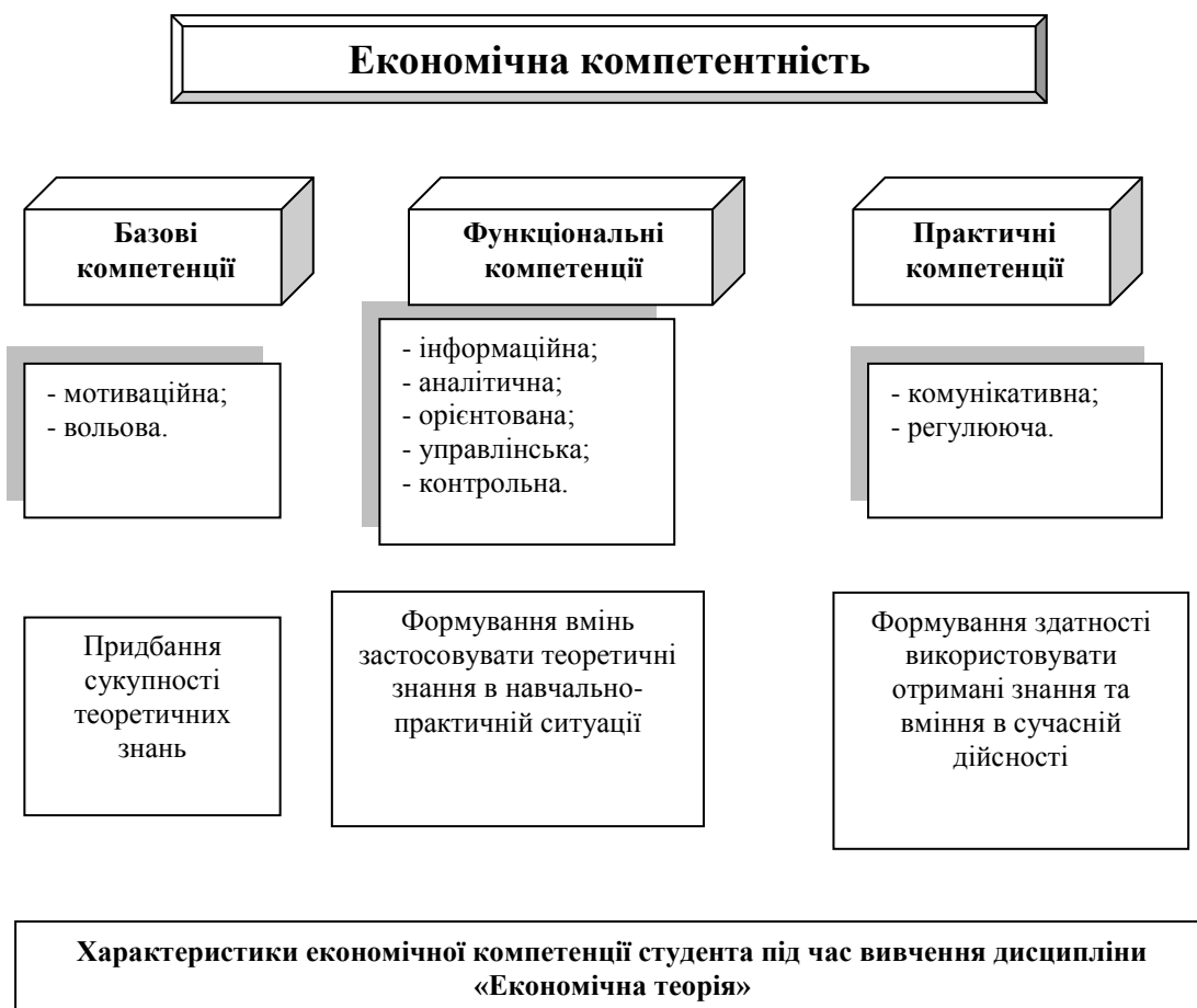
Рис. 2. Система економічних компетенцій студента

Більш детальну систему економічних компетенцій було сформовано і показано на рис. 2. [3]. Відвідані заняття, усне опитування, результати контрольних робіт та вивчення академічної документації свідчать, що зміст програмового матеріалу з основ економіки переважно засвоюється. Запропоновані письмові контрольні завдання для перевірки навчальних досягнень студентів відповідали діючим навчальним програмам з економіки на рівні обов'язкових критеріїв знань. Контрольні роботи виконували 161 студент. Це 73% від загальної кількості студентів, що вивчають предмет і показали такі результати: високий рівень – 20%, достатній – 41,5 %, середній – 33 %, початковий – 5,5 %. Це на 2,95% кращі показники від попереднього вивчення цього питання. Усього проведено 39 контрольних робіт у звичайній та тестовій формі, 11 усних опитувань. Аналіз відповідей показав, що студенти 4 курсів засвоїли навчальний матеріал на достатньому рівні. Студенти 4 курсів обізнані з перевагами та недоліками ринку, встановлюють зв'язок економіки з іншими науками, визначають функції грошей, їх типи та розв'язують задачі, студенти 3-го курсу пояснюють та розуміють значення економічних термінів і понять. Студенти перевірених груп вміють складати графіки, діаграми. Слід зазначити, що наші студенти є постійними призерами обласного етапу олімпіад з економіки.