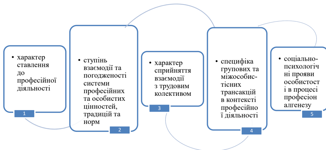
Рис. 1. Основні складові частини професійного самовизначення соціального працівника

Наголосимо, що професійне самовизначення – це соціалізований шлях гармонійного розвитку особистості, поєднаний зі здобуттям професійно-практичного та духовного досвіду в період навчання у вищій школі та вдосконаленням фахового зростання у процесі виконання професійних ролей та обов'язків, що є невіддільним атрибутом розкриття і здійснення особистісного професійного потенціалу [6]. Саме тому варто розглядати