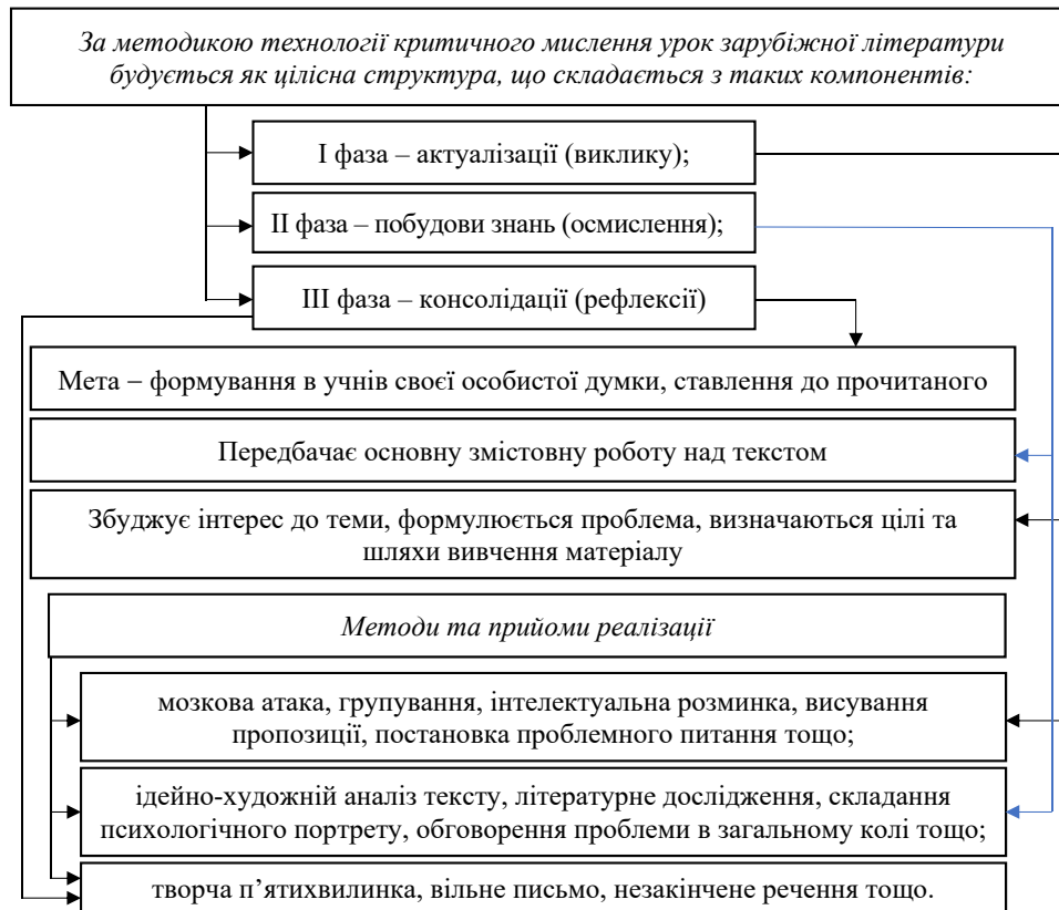
Рис. 2. Методика технології критичного мислення на уроках зарубіжної літератури

Немає чіткого алгоритму дій учителя з формування критичного мислення, однак існують