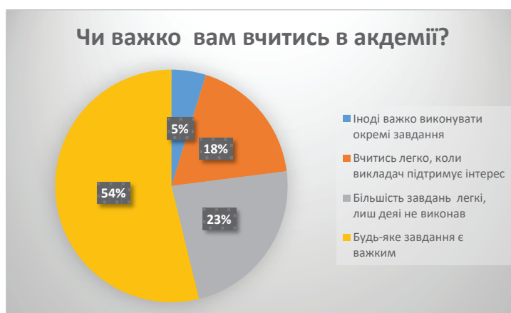
Рис. 1. Адаптація курсантів до навчання на початку вересня 2021 року

Організація освітнього середовища ВВНЗ має специфічні умови навчання, тому повинна задовольняти такі вимоги: обов'язкове виконання вимог дисциплінарних Статутів, у яких регламен-