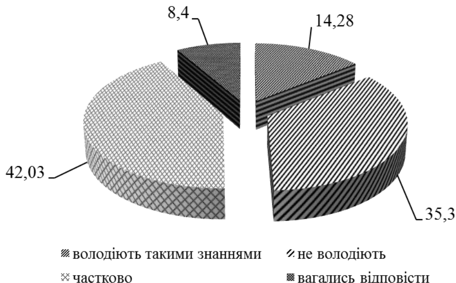
Рис. 1.3 Розподіл відповідей опитаних студентів щодо запитання «Чи володієте Ви вміннями оформлення договорів і контрактів з реалізації турів?» (%)

Також, на превеликий жаль, незадовільними виявились результати відповідей студентів на запитання «Чи володієте Ви вміннями оформлення договорів і контрактів з реалізації турів?», а саме: володіють цими знаннями лише 14,28% студентів, не володіють – 35,30%, частково володіє переважна більшість студентів – 42,03%, вагались відповісти – 8,40% студентів, що вдало демонструє рисунок 1.3.