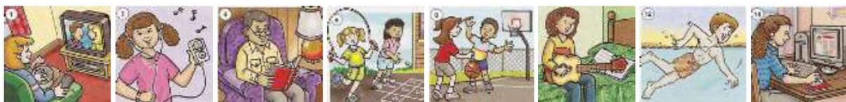
Рис.1. Комунікативна вправа «Розпорядок дня» з використанням малюнків [7, с. 4].

Особливо актуальним для цих вправ є використання завдань, які передбачають опору на досвід учнів, наприклад, розповісти про своє місто, про свою сім'ю або друзів тощо.