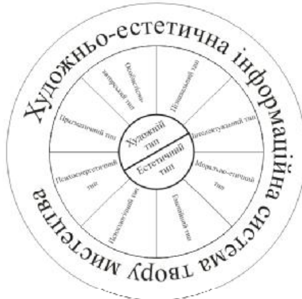
Рис.1. Структура художньо-естетичної інформації твору мистецтва

Художньо-естетична інформаційна система твору містить у собі n-кількість потоків. Типи інформації ( пізнавальна, художня, естетична, інтелектуальна, емоційна, психологічна, морально-етична, індивідуально-авторська, прагматична, психоенергетична ) формують естетичну структурну організацію, що характеризується одночасністю й синтезом усіх цих елементів художньо-естетичної інформації (ХЕІ) твору мистецтва.