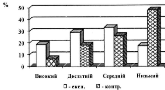
Рис. 3. Рівень підготовленості майбутніх аграріїв з фізкультурно-оздоровчої діяльності за когнітивним напрямом

Результати дослідження за діяльнісним напрямом засвідчили покращання результатів в експериментальній групі за рівнем засвоєння спеціальних знань, умінь, навичок здійснювати контроль фізичної підготовленості та стану здоров'я, правильно застосовувати на практиці засоби і методи фізичного виховання для розвитку фізичних якостей у процесі життєдіяльності, здійснювати планування фізкультурно-оздоровчого процесу у трудовому колективі.