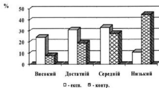
Рис. 4. Рівні підготовленості майбутніх аграріїв з фізкультурно-оздоровчої діяльності за діяльнісним напрямом

При цьому високий рівень готовності студентів до впровадження засобів фізичної культури і спорту під час роботи на виробництві виявився у 24,3 % студентів експериментальних груп і лише у 8,0 % студентів контрольних груп. Щодо достатнього рівня знань та вмінь також мають перевагу студенти експериментальних груп – 31,2 % та 19,1 % – у контрольних групах. Середній рівень становив в експериментальній групі 33,5 %, а в контрольній 27,8 %. Низький рівень в експериментальній і контрольній групах становив відповідно 11,0 % і 45,1 %, що вказує на високу ефективність нової методичної системи фізичного виховання студентів-аграріїв (рис. 4).