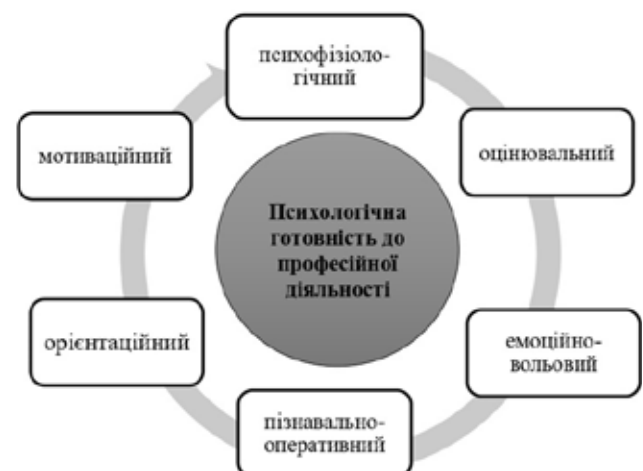
Рис. 1. Складники психологічної готовності до професійної діяльності

Основні принципи та складники психологічної готовності пов'язані із загальною готовністю до педагогічної діяльності. Складниками готовності до інноваційно-педагогічної діяльності є мотиваційно-ціннісний, когнітивний, операційно-діяльнісний, інтегративно-творчий, комунікативно-емпатійний, культурологічний, аналітико-рефлексивний та результативно-продуктивний. Розглядаючи структуру готовності до професійної педагогічної діяльності, можна виокремити такі її взаємопов'язані складники, як: мотиваційний – характеризується наявністю потреби успішно виконувати встановлене завдання, інтересу до об'єкта діяльності, способів її реалізації, прагнення до успіху; орієнтаційний – включає знання й уявлення про особливості та умови діяльності; операційний – передбачає володіння способами та прийомами діяльності, вміннями й навичками; вольовий – визначає внутрішню потребу