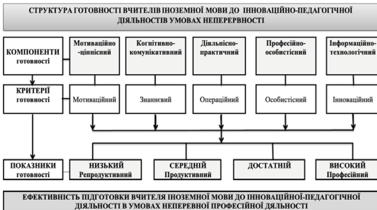
Рис. 2. Система компонентів і критеріїв структури готовності вчителів іноземних мов до інноваційно-педагогічної діяльності в умовах неперервної професійної підготовки

позитивне стійке ставлення до педагогічної професії; наявність інтересу до професійної діяльності та прагнення до саморозвитку й самовдосконалення; пізнання та аналіз педагогом власної діяльності; ціннісні орієнтації студентів; гуманістична спрямованість роботи з дітьми; прагнення до використання сучасних технологій навчання у професійній діяльності та самовдосконалення, підвищення власного рівня знань, умінь і навичок; наявність високого рівня сприйнятливості до нововведень, необхідність підвищення рівня професійної компетентності, професійної культури; здатність рефлексивно ставитися до себе в процесі діяльності, що пов'язано з постійною взаємодією з іншими людьми, прагненням зрозуміти їхні думки та дії; здатність до проєктування власної професійно-педагогічної комунікативної діяльності; володіння достатнім рівнем сформованості рефлексивних комунікативних умінь; здатність до самостійно-пошукової професійно-педагогічної комунікативної діяльності.