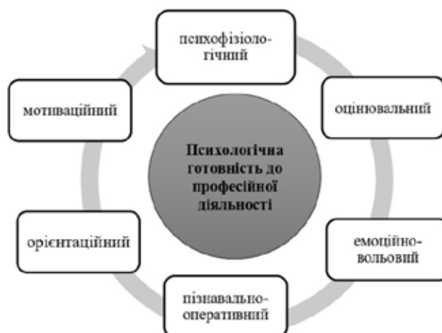
Рис. 1. Складники психологічної готовності до професійної діяльності

Основні принципи та складники психологічної готовності пов'язані із загальною готовністю до педагогічної діяльності. Складниками готовності до інноваційно-педагогічної діяльності є мотиваційно-ціннісний, когнітивний, операційно-діяльнісний, інтегративно-творчий, комунікативно-емпатійний, культурологічний, аналітико-рефлексивний та результативно-продуктивний. Розглядаючи структуру готовності до професійної педагогічної діяльності, можна виокремити такі її взаємопов'язані складники, як: мотиваційний – характеризується наявністю потреби успішно виконувати встановлене завдання, інтересу до об'єкта діяльності, способів її реалізації, прагнення до успіху; орієнтаційний – включає знання й уявлення про особливості та умови діяльності; операційний – передбачає володіння способами та прийомами діяльності, вміннями й навичками; вольовий – визначає внутрішню потребу