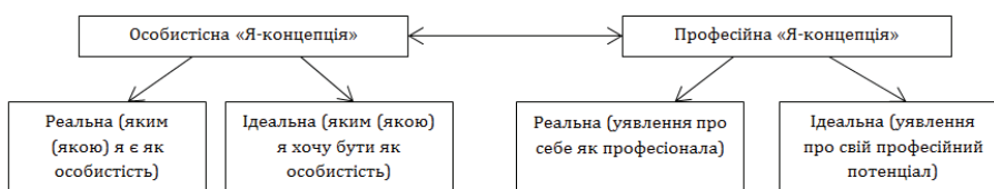
Рис. 2. Взаємозв’язок особистісної професійної «Я-концепції»

Висновки та перспективи подальших розробок у цьому напрямку. Отже, успішність і резуль-