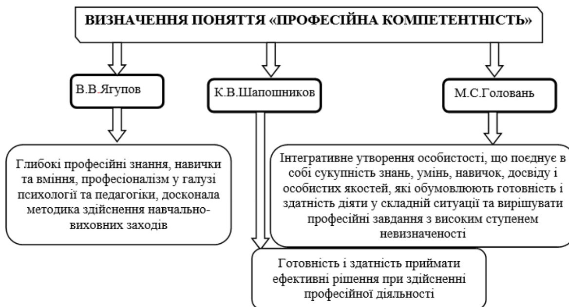
Рис. 1. Визначення поняття «професійна компетентність»

Реформування системи освіти в Україні свідчить про те, що роль педагога у формуванні нового покоління фахівців, громадян постійно зростає. Вимоги суспільства стосовно якості освіти, її практичного спрямування і застосування набутих знань у подальшій діяльності молодшого спеціаліста дуже часто демонструють невідповідність між очікуванням та отриманим результатом. У зв'язку з цим проблема компетентності або некомпетентності викладача спеціальних дисциплін, тобто не педагога за фахом, його готовності та спрямованості на педагогічну діяльність постає дуже гостро. Ми повинні з'ясувати, у чому полягає професійна, професійно-педагогічна та психолого-педагогічна компетентності викладача спеціальних дисциплін технічного коледжу.