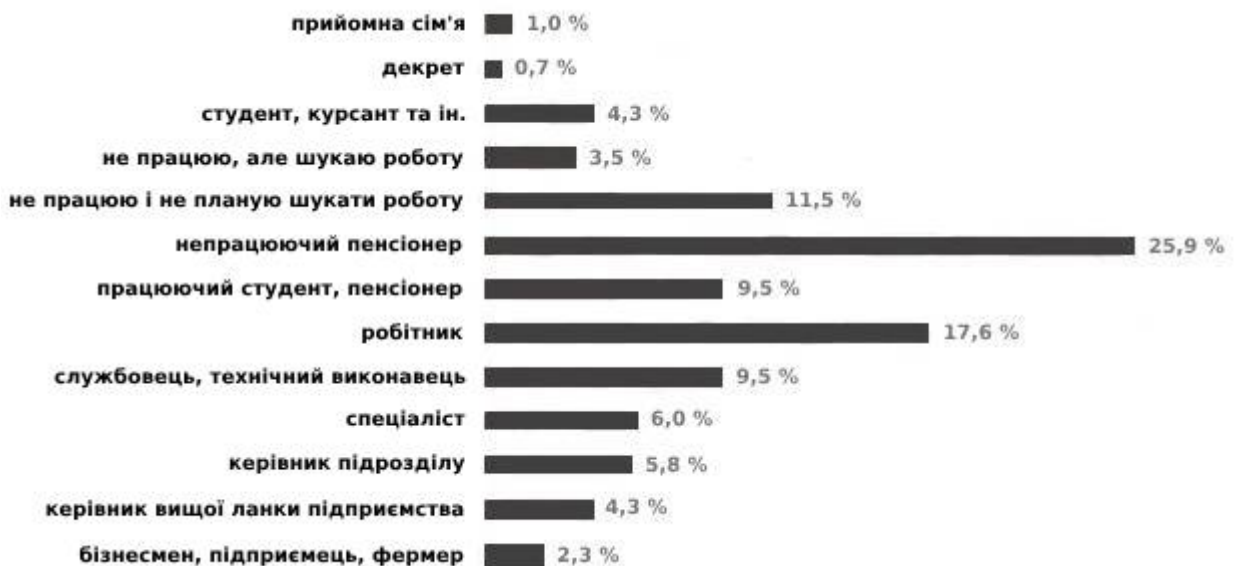
Рис. 3. Види діяльності респондентів