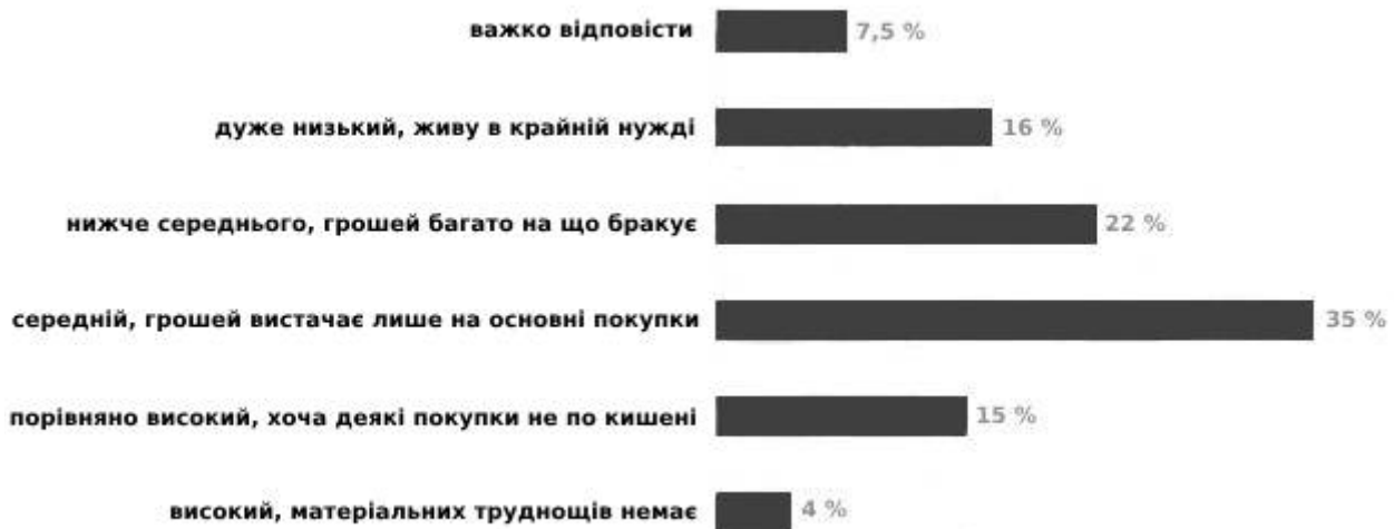
Рис. 2. Матеріальне становище респондентів

Також на респондентах була проведена оцінка інваріантності шкали довіри Ямагіші. Представлено статистики погодження для конфігураційної,