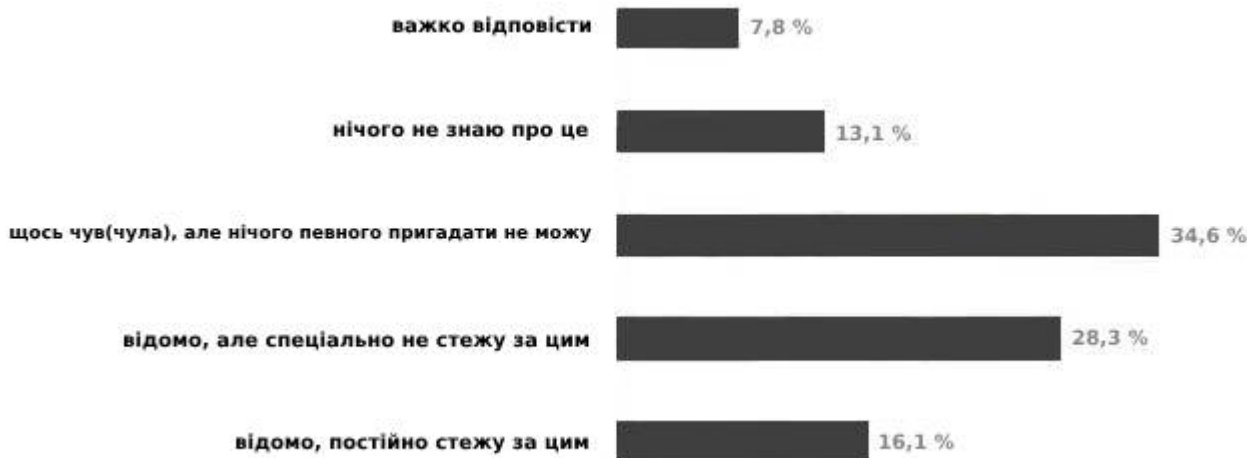
Рис. 4. Рівні обізнаності респондентів протидії корупції

З табл. 2 можна бачити, що підсумкова модель має досить хороші показники конфігураційної інваріантності, а також задовільні показники метричної ( \Delta CFI = 0,01 ) інваріантності. Це дозволяє нам порівнювати стандартизовані регре-