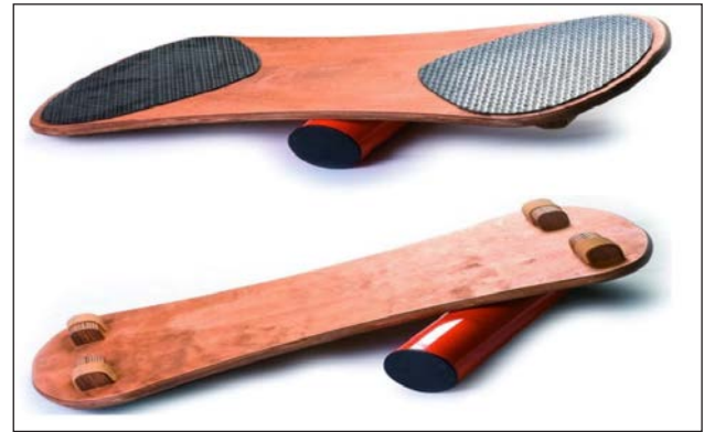
Рис. 3. Балансувальна дошка

Виконання. Спортсмен стоїть по середині шестикутника перед лінією А. За командою запускається секундомір, і він стрибає обома ногами через лінію В і назад у середину, потім – через лінію С і назад у середину, потім – лінію D і так далі. Коли спортсмен перестрибнув через лінію А і повернувся в середину, це вважається одним колом. Потрібно зробити три кола (зробити 36 стрибків) за найкоротший термін. Після завершення трьох кіл годинник зупиняється, і час записується.