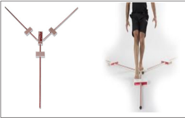
Рис. 2. Зображення “Y Balance Test Station”

Є велика кількість їхніх різновидів, хоча принцип дії всюди однаковий. Незалежно від того, балансувальна дошка якої фірми використовуватиметься, головне, щоб під час повторних досліджень використовувалася одна й та сама.