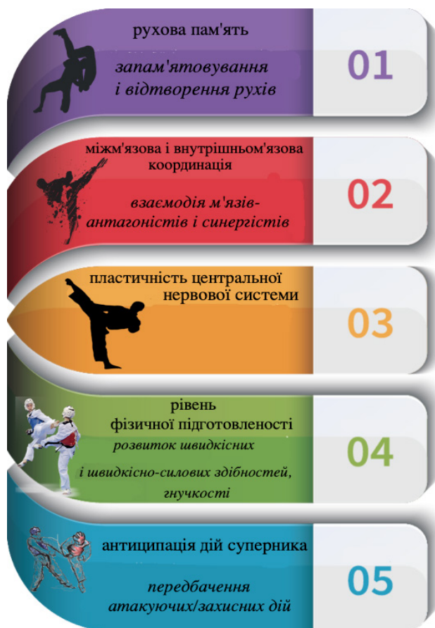
Рис. 1. Фактори розвитку координаційних здібностей в единоборстві

борств (різні удари руками й ногами до повного контакту)) [6].