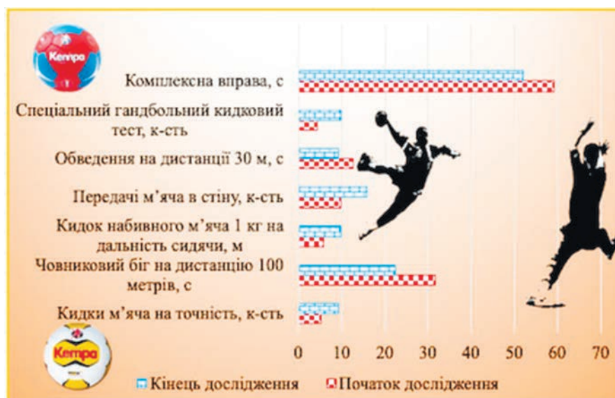
Рис. 1. Динаміка показників спеціальної фізичної підготовленості студенток 2-го курсу Запорізького національного університету контрольної групи протягом дослідження

Опираючись на програму ДЮСШ, нами обрані тести для оцінки спеціальної фізичної підготовки студенток 2-го курсу Запорізького національного