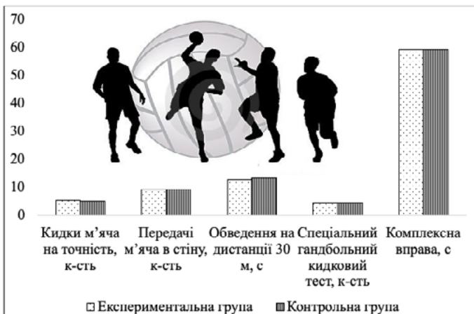
Рис. 1. Порівняння вихідних значень показників спеціальної фізичної підготовленості гандболісток обох груп