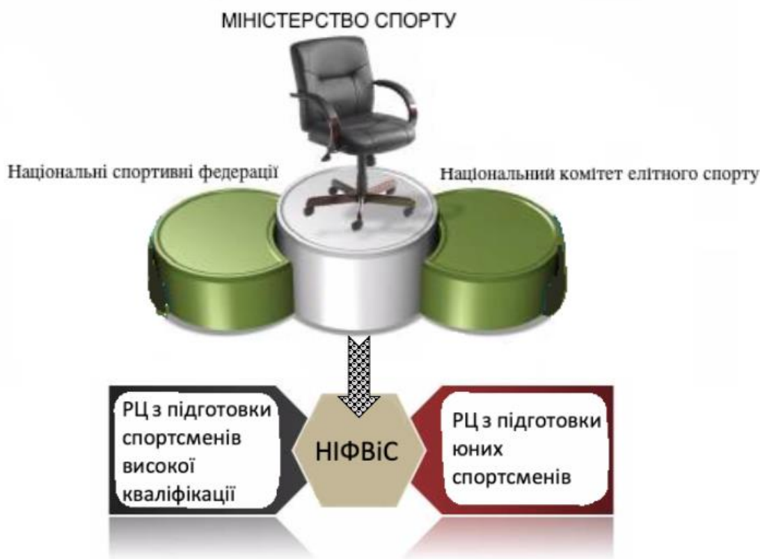
Рис 1. Організаційна структура спорту Франції

і самим спортивним федераціям, які визначають бонуси і витрати, що сплачуються персоналу. Державні службовці беруть участь у формуванні та здійсненні політики на рівні федерації, відборі і тренуванні елітних спортсменів, а також у підготовці власних технічних експертів федерацій. Друга частина державного фінансування набуває форми субсидій федераціям і клубам, а також місцевим органам влади для будівництва спортивних об'єктів.