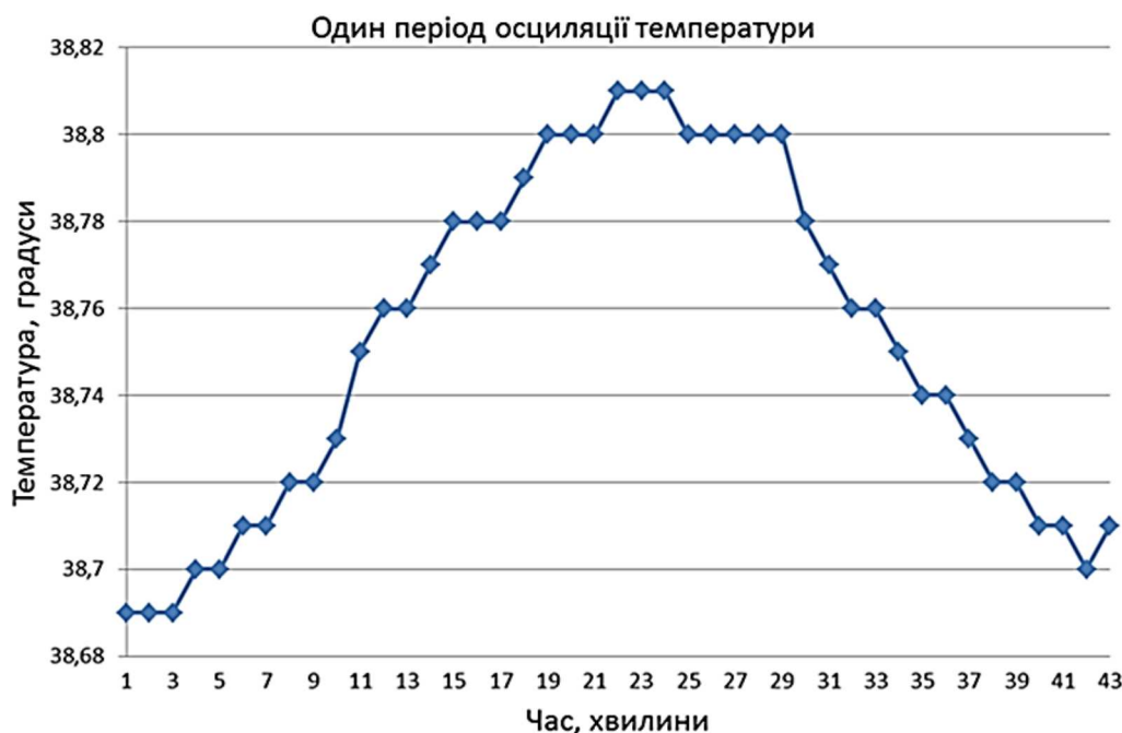
Рис. 1. Графік зміни температури середовища культивування ОКК з 40-хвилинним періодом її осциляції в термоосциляторі.