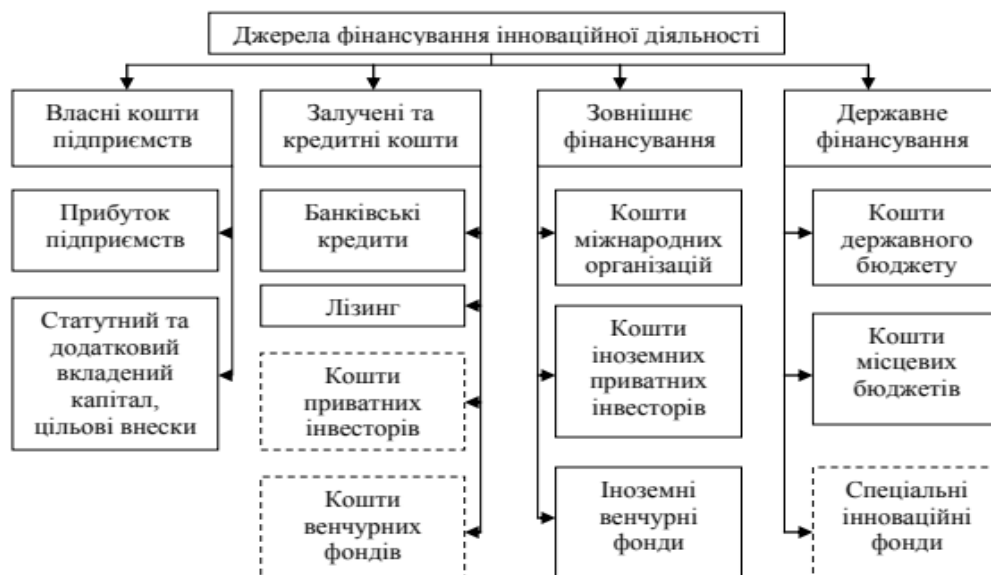
Рис. 1. Джерела фінансування інноваційної діяльності [10]

Джерела фінансування інноваційної діяльності наведено на рис. 1 [10].