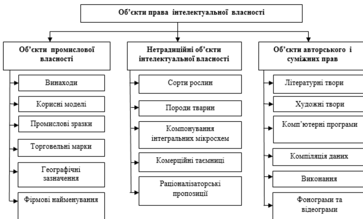
Рис. 1 Класифікація об'єктів права інтелектуальної власності (сформовано авторами на основі [2])