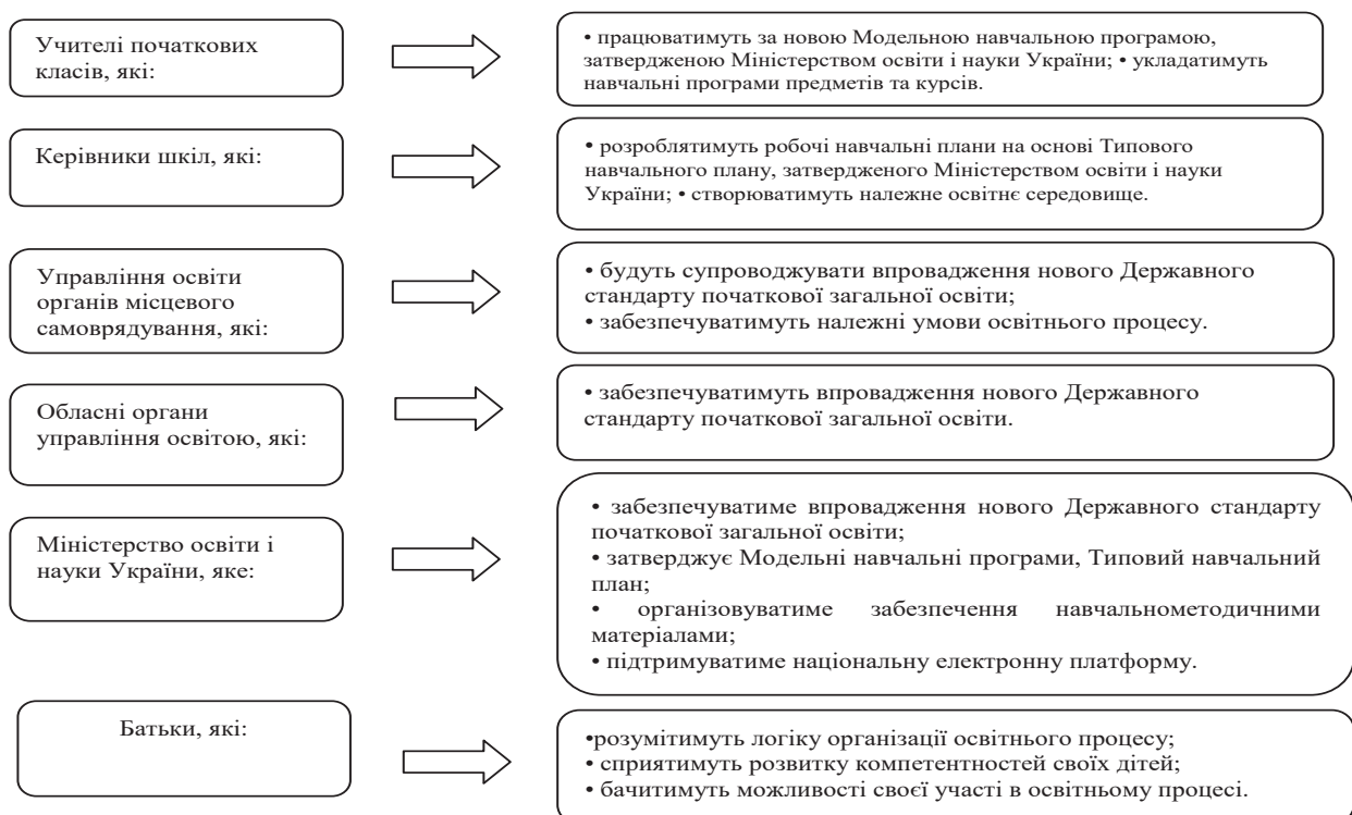
Рис. 3. Цільові групи Нової української школи

Серед нетрадиційних форм організації науково-методичної роботи з педагогічними кадрами у творчих групах необхідно широко запроваджувати інноваційні технології: педагогічного моделювання; проектні; технології виконання професійних завдань стосовно конкретних ситуацій, перевірки правильності та ефективності розв'язання і внесення необхідних коректив; проблемного навчання; технології, які розвивають рефлексивні дії; технології з розвитку нової культури;