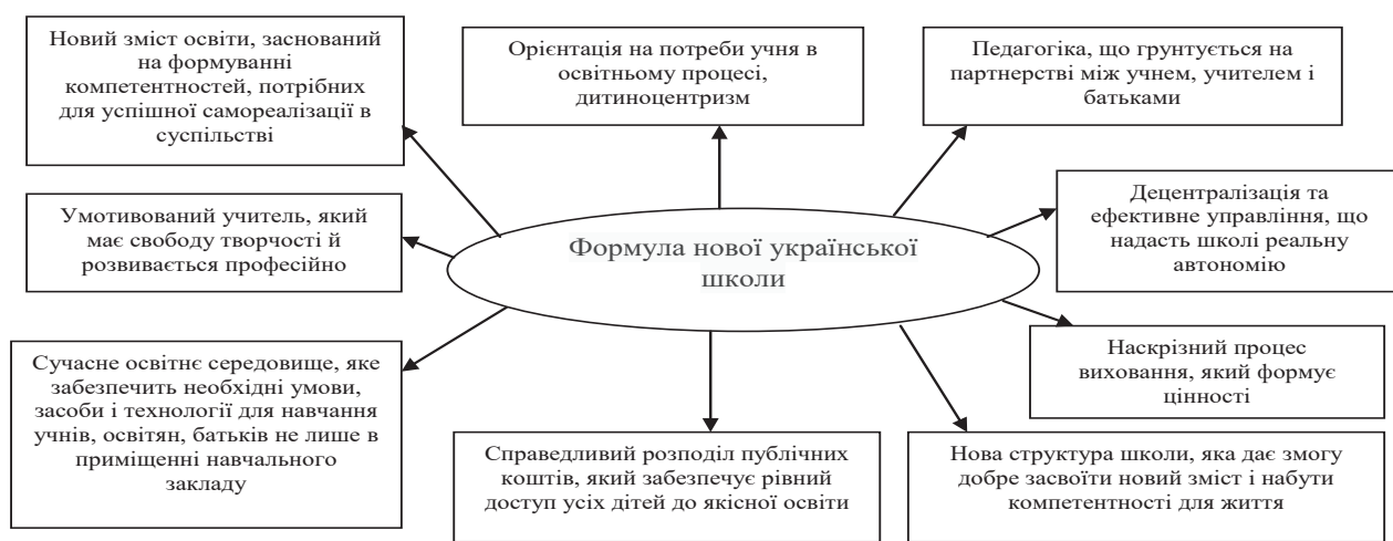
Рис. 1. Формула Нової української школи

Концепція Нової української школи передбачає розроблення нового Державного стандарту початкової загальної освіти, процес якого розпочався у середині 2016 року, а в липні 2017 року відбулося його громадське обговорення. Важливо зазначити, що процес розроблення Стандарту здійснювався у відкритому експертному діалозі, до якого були залучені найкращі педагоги-практики, науковці, громадські активісти, представники батьківських спільнот, міжнародні консультанти – понад 80 фахівців із різних регіонів