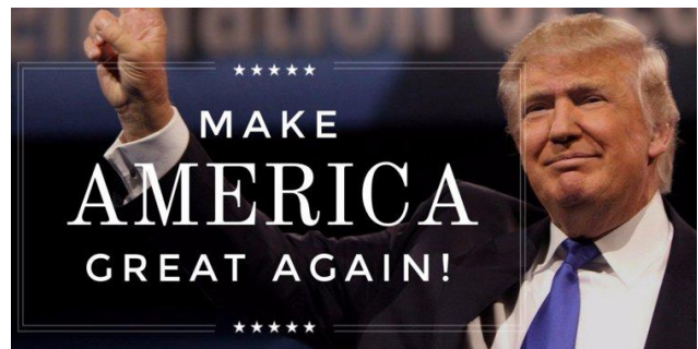
Рис. 2. Дональд Трамп та його лого на його веб-сайті 2015 року

Наступним прикладом вдалого позиціонування, яке привело кандидата до перемоги, було розроблено в ході маркетингової кампанії Дональда Трампа на виборах 2016 року. Амбіційний слоган «Make America Great Again», позиціонування себе як сильного лідера, який зможе підкреслити першість інтересів США у міжнародних відносинах, використання популістських ідей, акцентування уваги на протистоянні елітам, патріотизмі, економічних питаннях продемонстрували позиціонування через радикалізм, прямоту і антисистемність, що допомогло йому здобути підтримку значної частини американців, зокрема білих виборців середнього та робітничого класу.