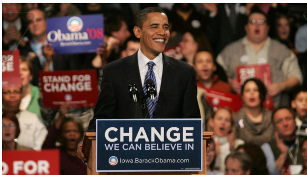
Рис. 1. Барак Обама за трибуною з надписом головного слогану

Головним слоганом кампанії Обами, що підкреслював необхідність змін у політиці США, став «Зміни, в які ми можемо вірити» («Change we can believe in»). Кампанія з акцентом на «зміні» та «надії» відрізняла його від попередніх політиків та конкурентів. Також акцент було зроблено на об'єднання країни: він наголошував на подоланні поділу між демократами і республіканцями, чорними і білими, молодими і старшими.