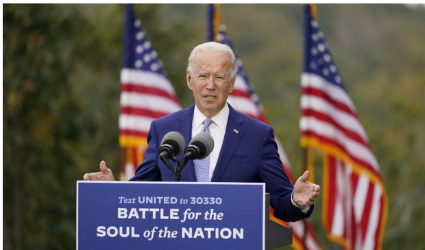
Рис. 3. Виступ кандидата у президенти від демократичної партії Джо Байдена Mountain Top Inn & Resort

Позиціонування Джо Байдена під час його виборчої кампанії 2020 року було засноване на кількох ключових темах, зокрема єдності, досвіді, відновленні довіри до влади та відповідальному лідерстві. Байден прагнув представити себе як альтернативу президенту Дональду Трампу, акцентуючи увагу на необхідності зміни керівництва і повернення до стабільності та нормальності.