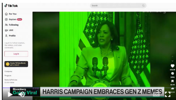
Рис. 1. Кампанія Harris включає мему покоління Z Джерело: [3].

Тренд з #bratsummer налічує майже мільйон публікацій у TikTok, а темою зеленого лайма користуються тисячі людей і компаній (Рис. 1).