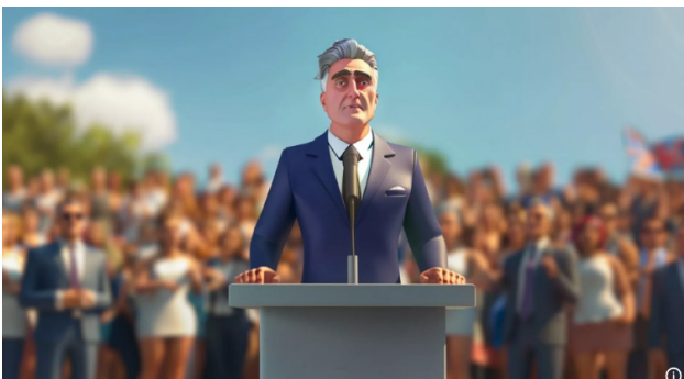
Рис. 4. Офіційний сайт AI Steve

Наприклад, на загальних виборах у Великобританії у 2024 році з'явилося нове штучне обличчя: AI Steve, створений на основі штучного інтелекту (Рис. 4-5).