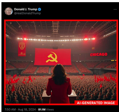
Рис. 7. Зображення, створене штучним інтелектом, опубліковане обліковим записом Х Д. Трампа, на якому зображено віце-президента Камалу Гарріс, яка виступає перед політичним з'їздом у радянському стилі

Д. Трамп часто використовує генеровані ШІ зображення, які висміюють або паплюжать його опонентів. Наприклад, нещодавнє підроблене зображення, яке він опублікував, де він показав, як віце-президентка К. Гарріс виступала на мітингу в радянському стилі з комуністичним прапором із серпом і молотом (Рис. 7).