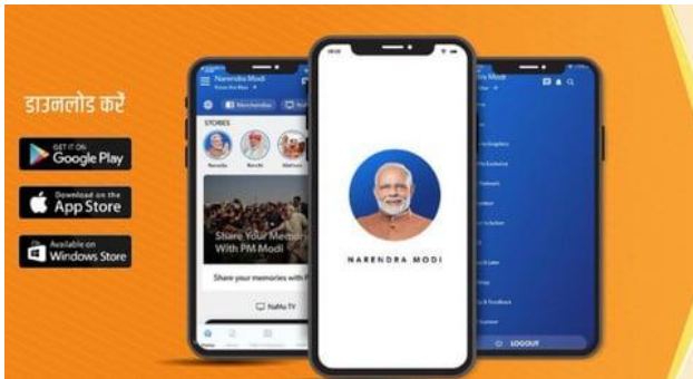
Рис. 3. Мобільний додаток Narendra Modi App.

з понад 10 мільйонами завантажень у Google Play Store. Додаток проштовхували через офіційні державні канали та роками збирали великі обсяги даних через непрозорі запити на доступ до телефону. Наприкінці 2019 року він отримав зміни, які включали події в прямому ефірі, «історії» про Моді, схожі на Instagram, стратегії залучення геймів, способи прийому мікропожертвувань і обіцянки прямої лінії з прем'єр-міністром [5].