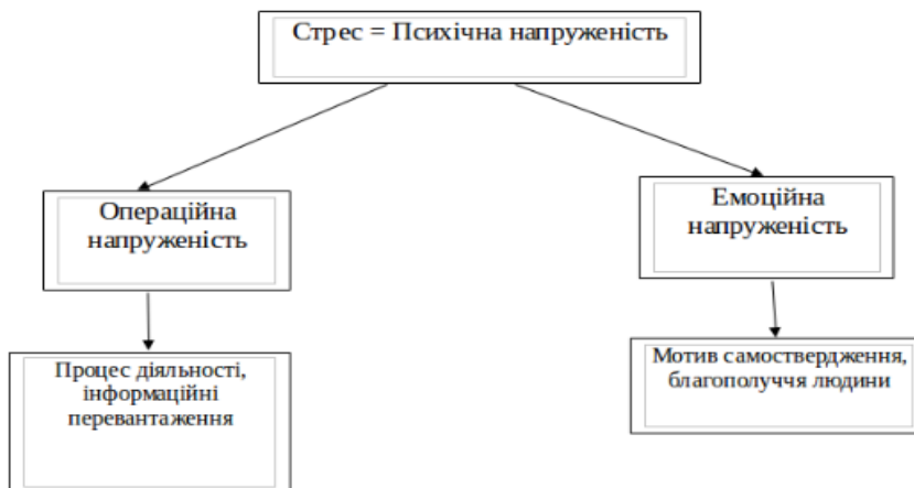
Рис.4. Структура стресу за Н.І. Наєнко

Вітчизняний дослідник Н.І. Наєнко запропонувала психічну напруженість ( психологічний стрес) розподілити на два види: операційну та емоційну.