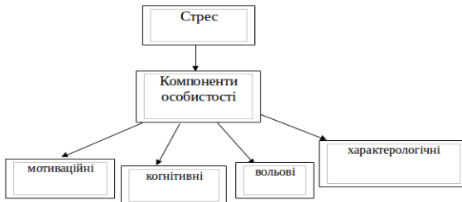
Рис. 3. Структура стресу за В.А. Бодровим

Російський вчений В.А. Бодров визначив стрес «як особливий психічний стан пов'язаний з зародженням і проявленням емоцій, але він не зводиться тільки до емоційних феноменів, а детермінується і відображається в мотиваційних, когнітивних, вольових, характерологічних та інших компонентах особистості» [1, с.2].