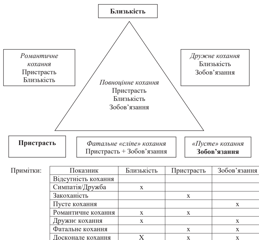
Рис. 1. Поєднання близькості, пристрасті й зобов'язань між складниками тріади кохання за Р. Стернбергом [12]

2. Симпатія/Дружба – «терміни, використані у нетривіальному сенсі. Краще відносити їх до почуттів у стосунках та характеризувати як дружбу. Людина відчуває близькість, пов'язаність