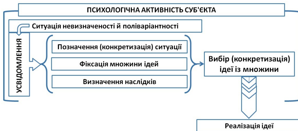
Рис. 1. Ухвалення рішення: модель

Особистісно-діяльнісний підхід дає змогу досліджувати психологічну готовність як системну цілісність відповідних якостей та властивостей особистості, які забезпечують ефективну діяльність у певній сфері. Основою розуміння готовності є наявне ставлення особистості