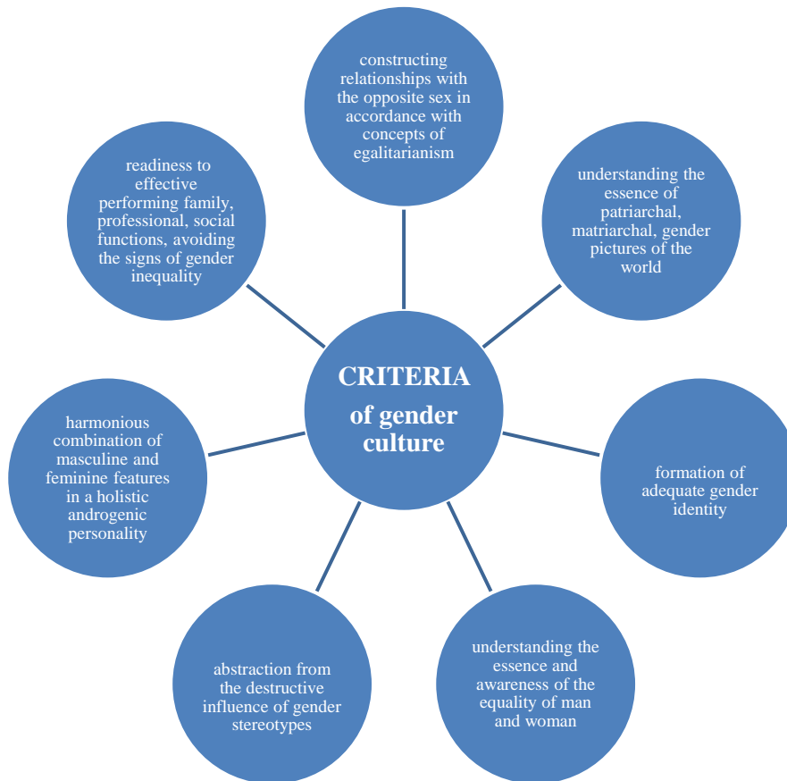
Fig. 2. Criteria of gender culture of the future teacher

The value-personal component is determined by the nature of the attitude of future teacher to the problems of gender, which expresses in levels of formation (non-formation) of gender sensitivity. The aspect of value is central in the philosophical definition of gender culture. Gender values are the keys to understanding of gender culture in the past and in the present [9].