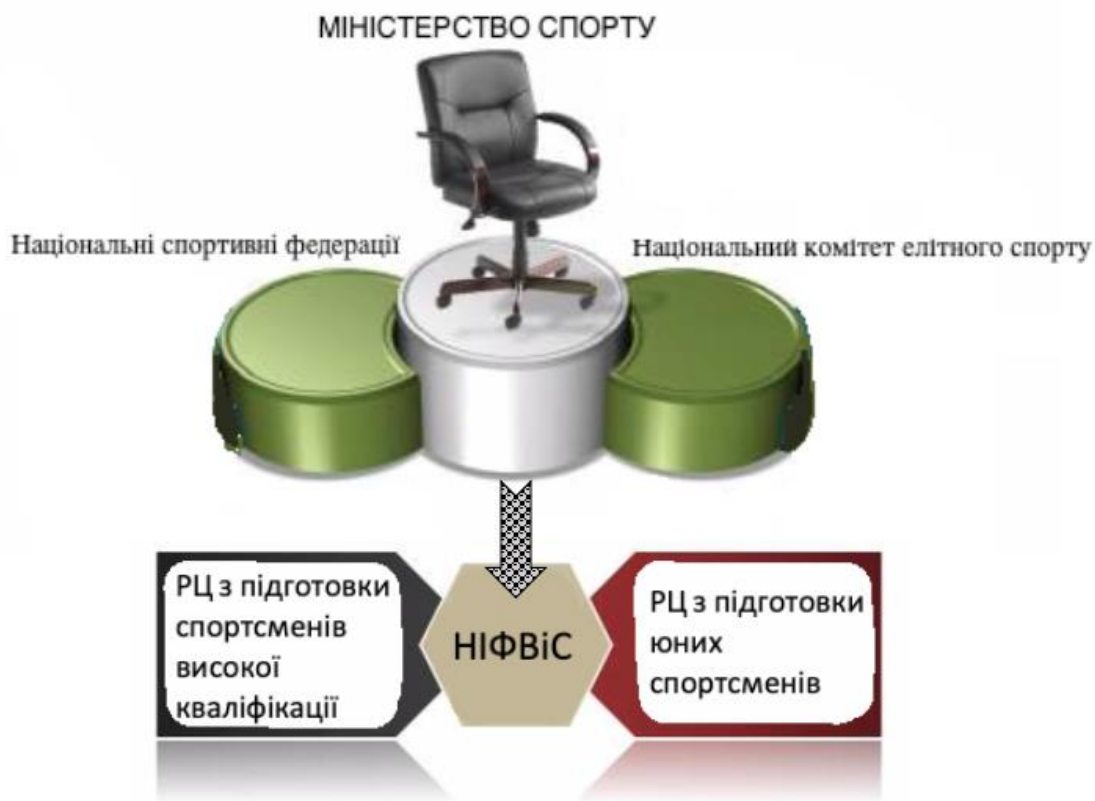
Рис 1. Організаційна структура спорту Франції

і самим спортивним федераціям, які визначають бонуси і витрати, що сплачуються персоналу. Державні службовці беруть участь у формуванні та здійсненні політики на рівні федерації, відборі і тренуванні елітних спортсменів, а також у підготовці власних технічних експертів федерацій. Друга частина державного фінансування набуває форми субсидій федераціям і клубам, а також місцевим органам влади для будівництва спортивних об'єктів.