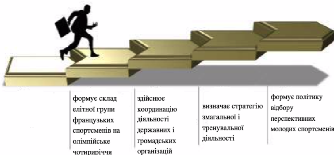
Рис. 2. Основні завдання Національного комітету елітного спорту Франції

державному і приватному секторах) безпосередньо пов'язані зі спортом [9]. Для об'єктивної диференціації спортсменів щодо їхніх можливостей досягти високих результатів на міжнародному рівні атлетів поділяють на чотири групи, списки яких затверджує Міністерство. Це елітні спортсмени (приблизно 700-800 осіб), спортсмени високої кваліфікації (2600-2700), юніори (3400-3500) і спортсмени віком до 12 років і 14 років, які мають передумови для досягнення результатів світового рівня (приблизно 8500 осіб). Списки елітних спортсменів оновлюються раз на два роки, решта – щорічно [3, 4, 5].